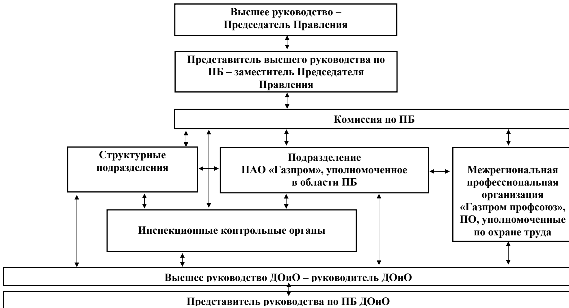
Схема структуры Единой системы управления производственной безопасностью в ПАО «Газпром»